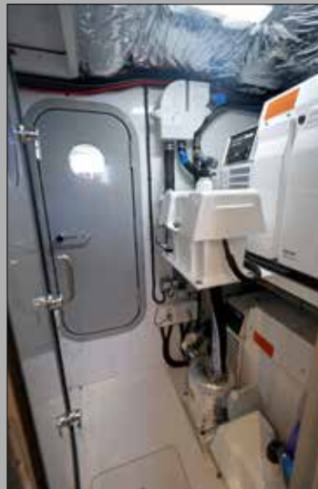
Entre la cabine marin et la salle des moteurs, un sas abrite générateurs et dispositif hydraulique.