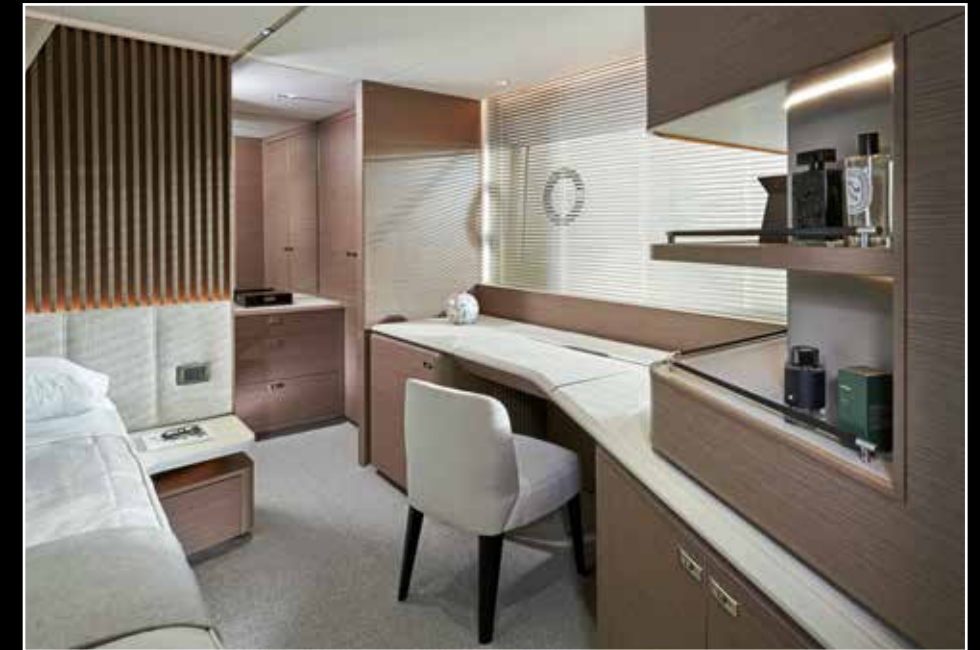
La suite est équipée d'un élégant coin bureau avec étagères d'angle intégrées et coiffeuse dissimulée sous le plateau. Au fond, le dressing, sas d'entrée de la salle de bain traversante.