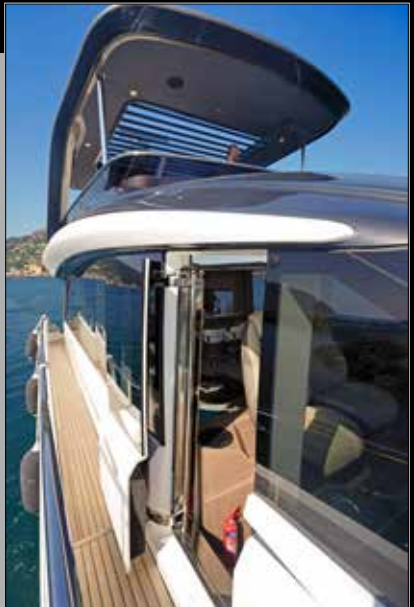
La porte latérale côté pilote est d'une robustesse à toute épreuve. Princess est intransigeant sur la sécurité.

► salle des machines se situe dans le prolongement et dispose d'un isolement phonique parfait, digne d'une berline Mercedes. Pas un bruit, pas une vibration ressentie dans les espaces de vie. Perfection technique, mais aussi des aménagements. Dans ce domaine, le constructeur anglais s'est fait aider du cabinet de design italien Pininfarina. La timonerie se distingue par ses vitrages latéraux panoramiques sur toute la longueur et une surface parquet satiné et moquette épaisse de plain-pied du cockpit jusqu'au poste de pilotage. L'agencement est d'une notable ►