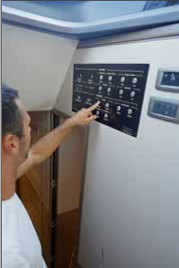
Au pied de la descente centrale, ce tableau électrique simplifié permet d'agir sur les fonctions essentielles.

Le constructeur de Plymouth fait preuve d'un sens pratique largement éprouvé. Un florilège d'astuces et d'aménagements améliorés au fil de l'expérience.