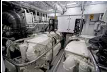
Bien insonorisée, la salle des machines héberge les blocs MAN V12 développant 1650 ch chacun.