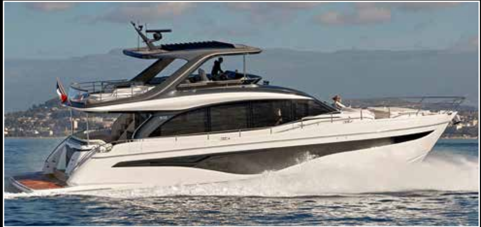
Avec sa motorisation la plus musclée, le Y72 file à 32 nœuds maxi et navigue en croisière à 24 nœuds pour une conso de 440 l/h.

► fluidité avec la cuisine américaine à l'entrée et le double salon. L'encombrement du mobilier est optimal et toujours à hauteur de taille pour favoriser les déplacements et ne pas nuire à la perspective. Le travail du bois est remarquable. Aucune arête vive au niveau des consoles et des placards. L'ensemble renvoie une image grand luxe très « british » qui peut trancher avec le traitement plus exubérant des concurrents italiens. Le propriétaire dispose d'une suite avec large escalier privatif et agrémenté d'un imposant hublot rien que pour lui. Princess avait déjà