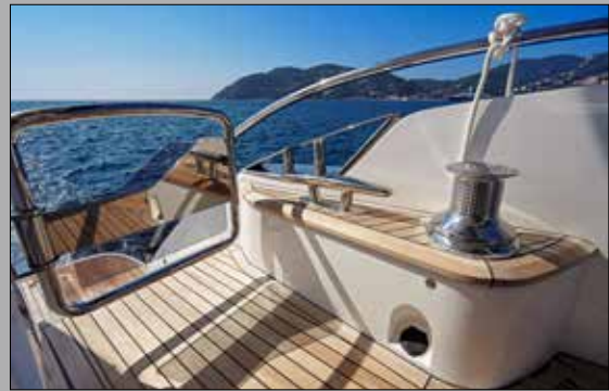
Princess a augmenté la qualité de ses pièces inox, qui sont souvent réalisées au sein de sa propre usine.