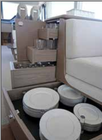
Face à la cuisine, des tiroirs abritent la vaisselle pour dresser la table facilement.