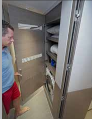
Dans la coursive du pont inférieur, un placard dissimule des rangements et un lave-linge.