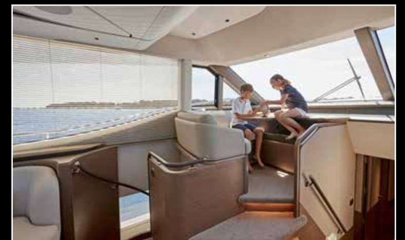
Sur le flanc bâbord, un très joli coin salon permet à l'équipage de suivre la navigation aux premières loges. Derrière, l'escalier menant à la master.

Confort garanti pour le pilote et le copilote qui bénéficient de deux fauteuils ergonomiques réglables électriquement. Le tableau de bord intègre trois écrans, dont un signé Böning pour toutes les données du bateau.