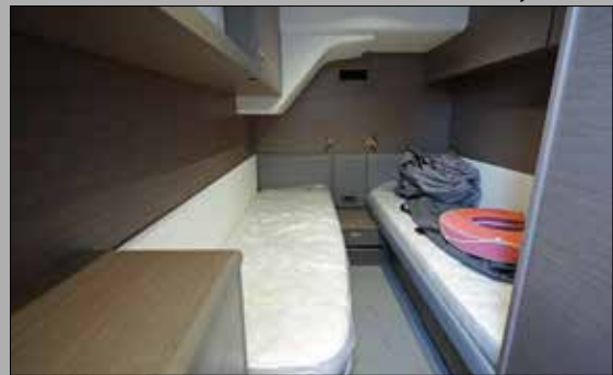
Le chantier reste fidèle au principe de la cabine marin accessible depuis le tableau arrière. Une solution éprouvée!