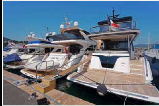
Bord à bord, deux générations de Princess 72, à gauche, l'autre de 2021. Un ADN commun, mais des styles et des finitions qui font la différence.

Le hasard fait parfois bien les choses! Lors de notre venue à Mandelieu (06) pour le test du nouveau Y72, celui-ci était amarré à côté du modèle de 2010. Pas de doute, ils font bien partie de la même famille et il est d'ailleurs surprenant de constater que, dix ans après, l'ancienne génération tient encore le cap! Où se situent les différences? Beaucoup sur les dimensions des vitrages de coque et de timonerie, sur le design aussi, comme sur les volumes extérieurs, mieux façonnés sur la version 2021. Le niveau de finition n'est plus le même. Il suffit de comparer le travail sur les pièces en inox telles que le balcon pour s'en convaincre. Et enfin, il y a tout ce qui ne se voit pas: les progrès de l'ingénierie, les matières plus techniques et l'efficacité des nouveaux équipements liés à la domotique et au confort à bord.